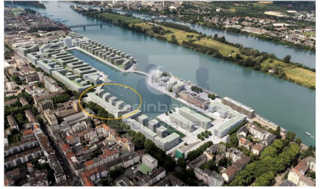
Luftbild künftige Bebauung